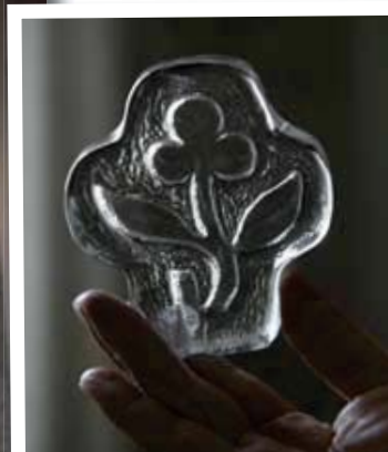
Sjukhuskyrkans symbol är en avhuggen gren där en blomma spirar. Det symboliserar att det sönderbrutna kan bli helt, ur hopplöshet kan liv växa fram. Korset berättar om tro, hopp och kärlek.